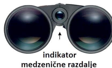
Slika 4: Zenična razdalja

Razdalja med zenicama se od človeka do človeka razlikuje. Da bi dosegli optimalno nastavitev, daljnogled držite v položaju za opazovanje in obe polovici daljnogleda premikajte navzven ali navznoter (Slika 4), dokler pri pogledu skozi oba okularja ne zagledate samo eno okroglo sliko. Tako je daljnogled pravilno nastavljen za zenično razdaljo vaših oči.