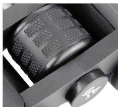
Slika 5: Gumb za ostrenje osrednji gumb za ostrenje